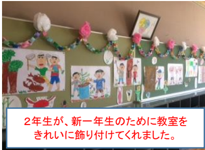
2年生が、新一年生のために教室をきれいに飾り付けてくれました。

一人一人の児童が新しい学年、小学校で「こんなことができるようになりたい」「こんな活動で頑張りたい」という気持ちをもって迎えた今日。どの児童の胸にも、新しい年度を頑張ろうという気持ちが必ずあります。頑張って応援していきます。ご支援をお願いします。